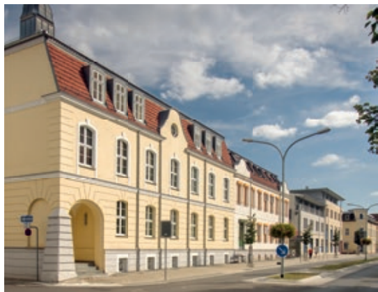
Bürgersprechstunde im Landkreis Märkisch-Oderland in Seelow am 28. Juni 2022

die den Petitionen zugrunde liegenden Probleme besser zu veranschaulichen. Auch können lösungsorientierte Gespräche vor Ort mit anwesenden Petenten und Behördenvertretern geführt werden.