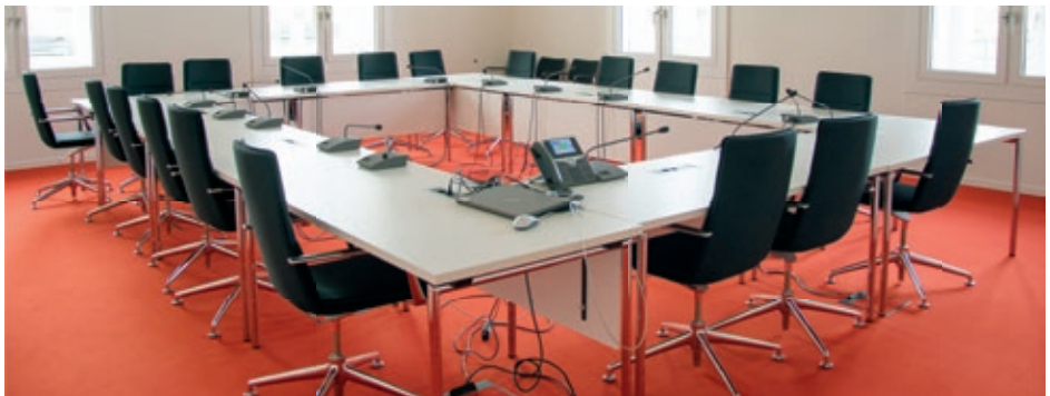
Sitzungsraum des Petitionsausschusses