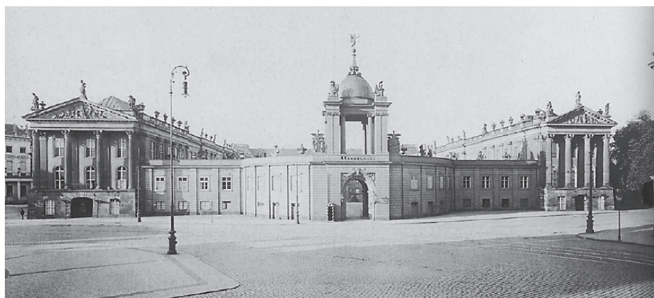
Historyczny zamek miejski w Poczdamie.

W 1726 roku salę w piwnicy przebudowano na piwnicę winiarską oraz dokonano niewielkich napraw w pozostałej części zamku. W tym samym czasie król rozbudowywał Poczdam, który stopniowo stawał się miastem garnizonowym. Powiększane w regularny sposób o nowe dzielnice miasto przyjęło wyraźną for-