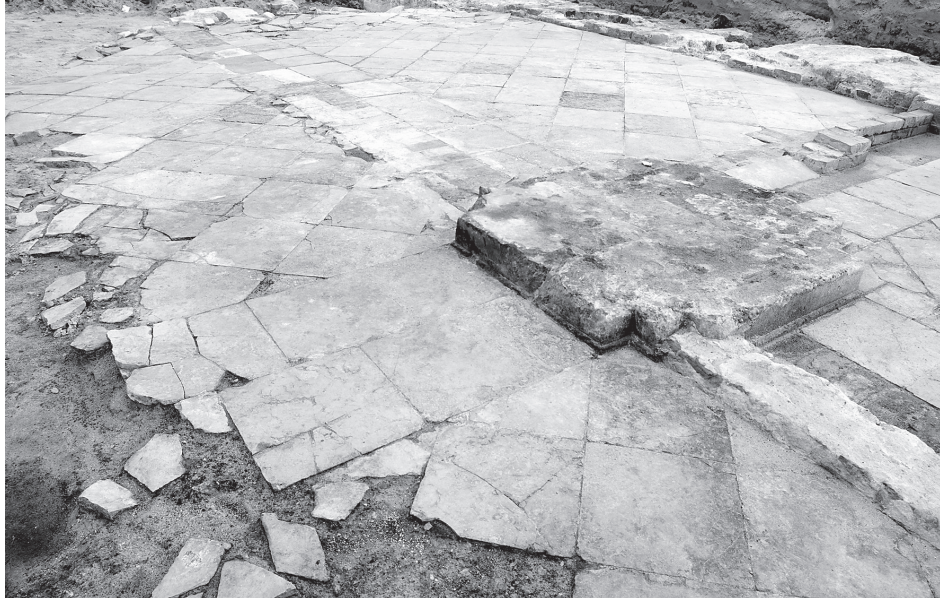
Zabezpieczenia archeologiczne: kamienna podłoga z jadalni Wielkiego Elektora z XVII wieku. W nowym gmachu Landtagu przez „Okno Archeologiczne” można zobaczyć historyczną podłogę.