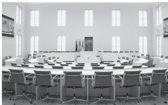
Sala plenarna Parlamentu Krajowego Brandenburgii w sierpniu 2014 roku.

na parterze mieści się parlamentarnej służba administracyjna. Powyżej, na pierwszym piętrze umieszczono biu-