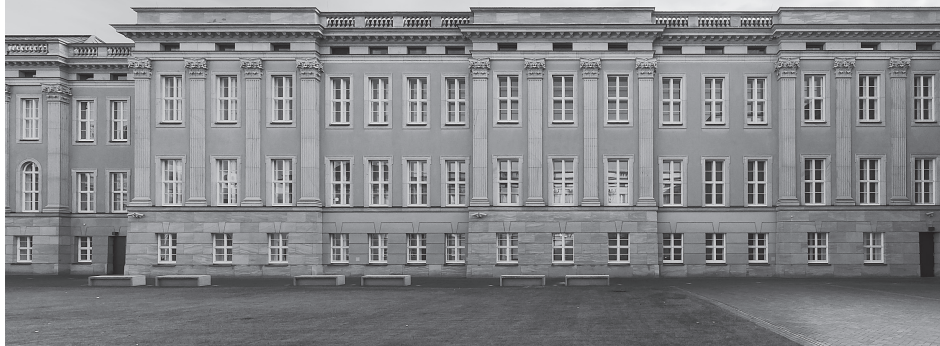
Fasada skrzydła wschodniego od strony dziedzińca.

ra frakcji SPD wraz z salą obrad frakcji i komisji w południowo-zachodnim skrzydle.