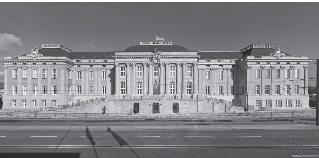
Widok na nowy budynek Parlamentu Krajowego Brandenburgii