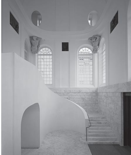
Klatka schodowa Knobelsdorffa w nowym gmachu parlamentu.