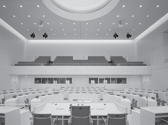
Widok z prezydium plenarnego na łóżę dla gości w styczniu 2014 roku.

rowych stanowisk pracy. Parking podziemny liczy 166 miejsc postojowych dla samochodów osobowych (w tym 9 miejsc dla niepełnosprawnych) i 100 miejsc do parkowania rowerów.