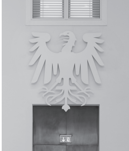
Biały orzeł pierwotnie zawieszony w sali plenarnej.

ty to oryginalne elementy, przy czym architekt, nie chcąc zatrzeć śladów historii, zadbał o to, aby rzeźby nie zostały odnowione,