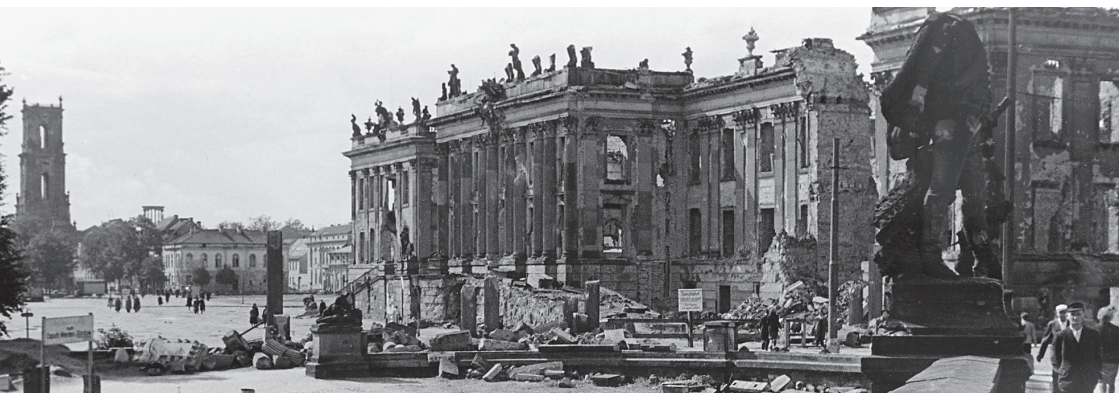
Zniszczony zamek miejski w Poczdamie.

Podczas brytyjskiego nalotu na miasto w dniu 14 kwietnia 1945 roku zamek miejski doszczętnie spłonął, zachowały się jedynie mury go okalające. Tylko nie-