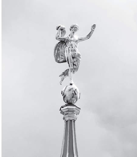
Fortuna znów unosi się pod poczdamskim niebem.

budowli. Pierwszą łopatę wbito 8 września 2000 roku, a uroczyste otwarcie odbyło się 12 października 2002 roku.