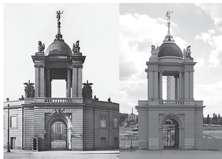
Historyczny Portal Fortuny i jego wersja zrekonstruowana w 2002 roku.

się reprezentacyjna sala, zwana później „Salą Marmurową”. Pod nią, na niskim parterze zamku, połączona z „Parkiem Przyjemności”, znajdowała się podpiwniczona sala, którą w miesiącach letnich wykorzystywano jako jadalnię zapewniającą chłód, ale również jako miejsce przechowywania zwłok zmarłych krewnych rodziny książęcej.