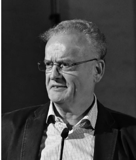
Dr. h.c. Friedrich Schorlemmer

War das nicht ein schöner Moment in unserem Leben und für die deutsche Freiheitsgeschichte? Dass so lang Geduckte endlich aufmuckten! Dass sie dem schlagkräftigsten Argument trauten und den schlagfähigen Sicherheitsorganen der SED entgegentraten, statt weiter verängstigt in den Nischen zu verharrern! Macht des Arguments gegen das Argument der Macht! Das erwies sich als unausgesprochene Parole friedlich entschlossenen Widerstands. DDR-Bürger, also die Deutschen im Osten, im eingemauerten Osten, verließen ihre Nischen und ihre politische Lethargie, überwandnen ihre Angst und fanden Gefallen an eigenständiger politischer Mitwirkung.