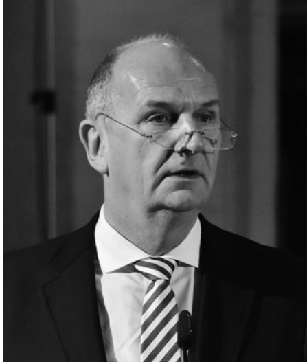
Dr. Dietmar Woidke