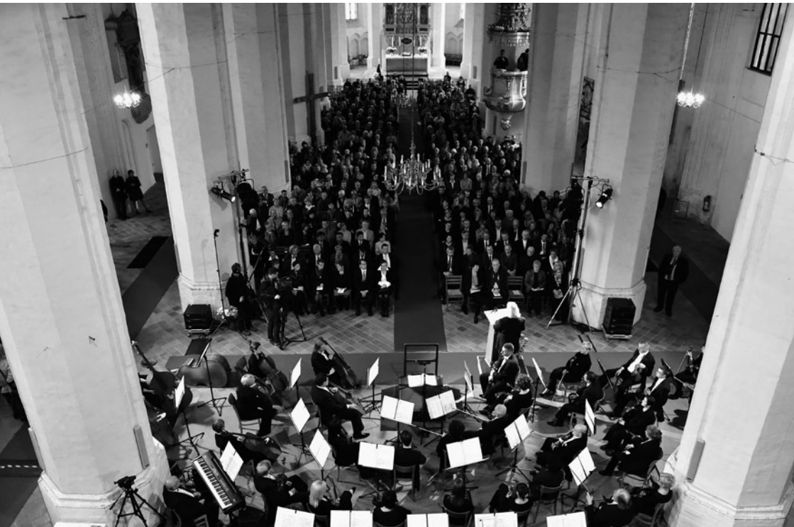
Festakt in der Oberkirche St. Nikolai