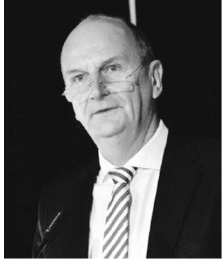
Dr. Dietmar Woidke

Lassen Sie mich an dieser Stelle die ehemaligen Häftlinge und Ihre Angehörigen begrüßen. Wir stehen gemeinsam in der Verantwortung, die Erinnerung an Ihr Schicksal hochzuhalten! Und deshalb, meine Damen und Herren, ist diese Veranstaltung Ihnen gewidmet!